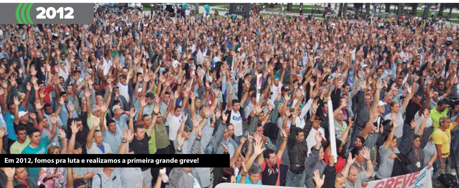
Em 2012, fomos pra luta e realizamos a primeira grande greve!

No Paraná, nosso aumento é o maior entre todas as categorias! Págs. 2 e 3