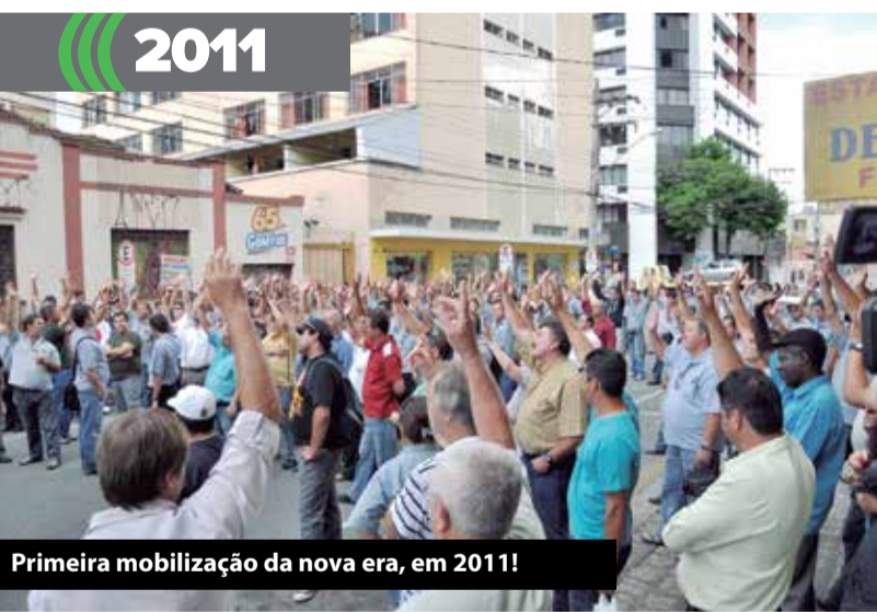
Primeira mobilização da nova era, em 2011!