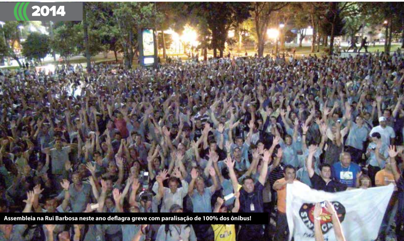
Assembleia na Rui Barbosa neste ano deflagra greve com paralisação de 100% dos ônibus!