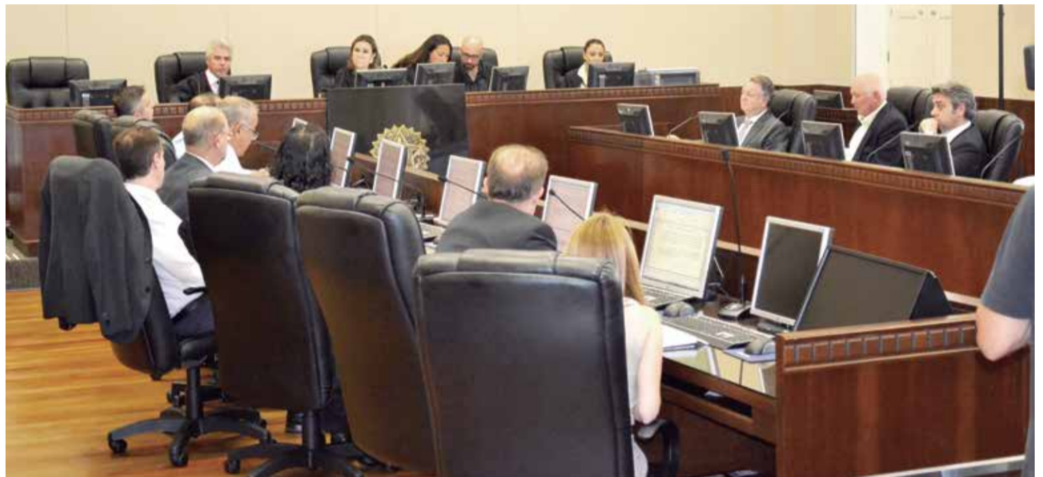
“Negociação entre Sindimoc, Patronal e Urbs no Tribunal Regional do Trabalho”