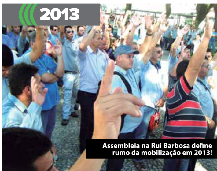
Assembleia na Rui Barbosa define rumo da mobilização em 2013!